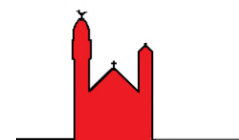
Notre Dame du Rosaire

Lundi à 10h Mercredi à 18h30 Vendredi à 10h