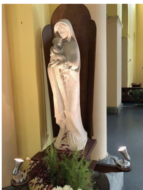
Statue de la Vierge, église Saint-Job

Prénom Côme de Patoul, né en avril 2023, Genève, Suisse, le baptême a été célébré le dimanche 22 octobre à Sainte-Anne.