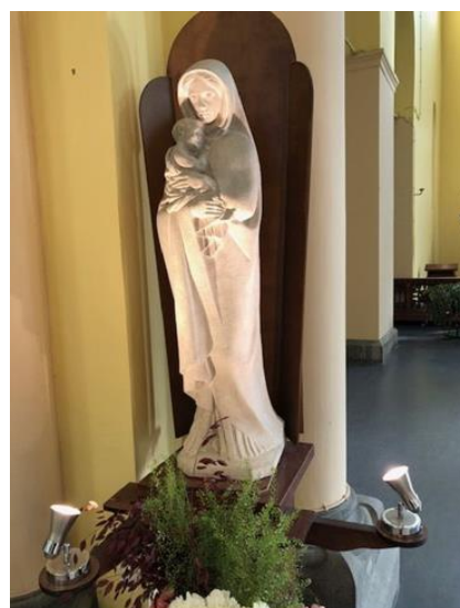
Statue de la Vierge, église Saint-Job