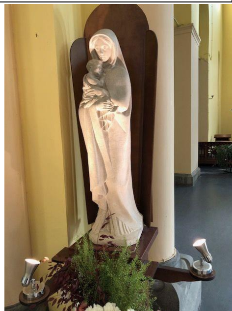
Statue de la Vierge, église Saint-Job