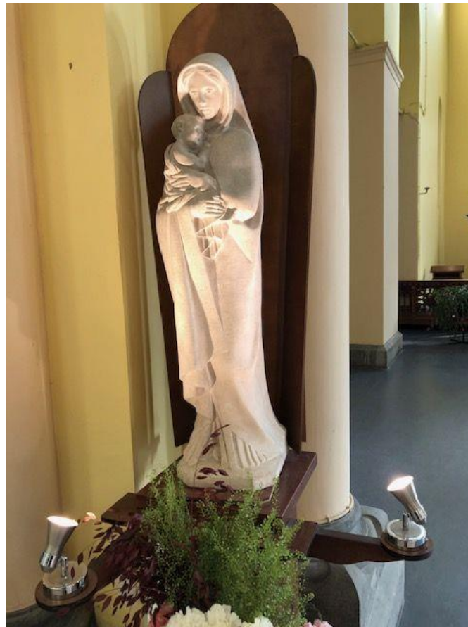
Statue de la Vierge, église Saint-Job