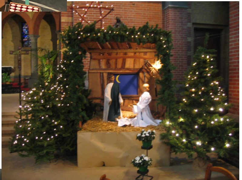
N.-D. du Rosaire